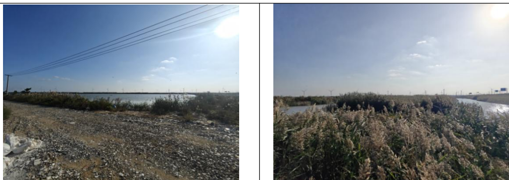
图3-1 项目地址现场踏勘

据现场调查，项目场址用地现状为鱼塘，养殖类型为常见经济水产，项目周边主要为鱼塘及道路，未发现珍稀、濒危植物，未见挂牌名木古树。本项目利用鱼塘水面建设，不涉及耕地、永久基本农田、林地、湿地、生态红线及生态管控区，土地使用形式为租赁，用地性质为工业用地、采矿用地，土地利用现状为鱼塘，项目建设完成后不改变用地性质，光伏组件下鱼塘仍作为渔业养殖使用。