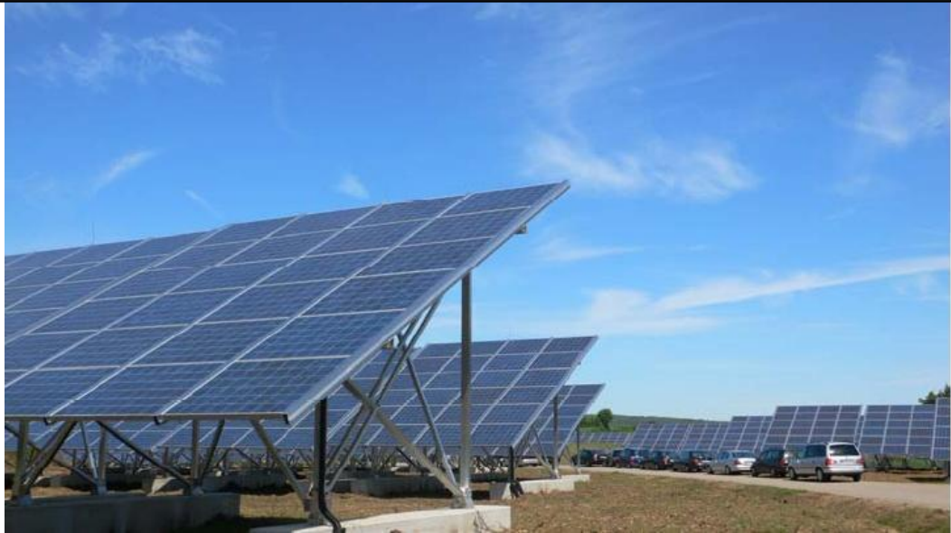
图2-1 固定式安装方式