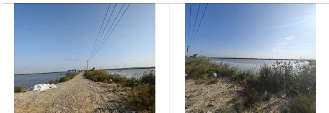
图3-1 项目地址现场踏勘